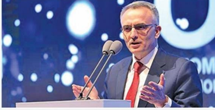
OYDER'in Otomotiv Kongresi'nde konuşan Ağbal otomotiv sektörünün kamu için önemli bir kaynak olduğunu ifade etti.