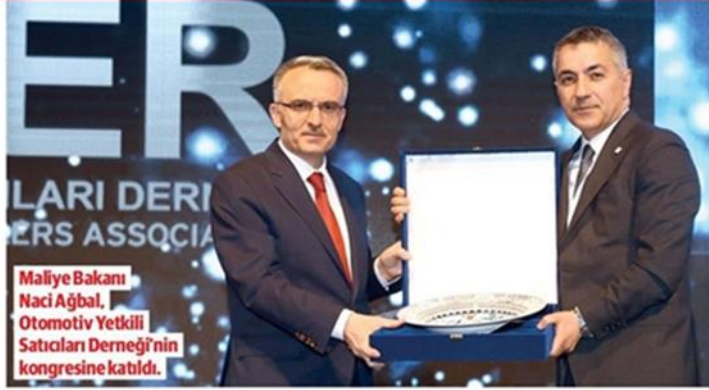
Maliye Bakanı Naci Ağbal, Otomotiv Yetkili Satıcıları Derneği'nin kongresine katıldı.

▶ OYDER Başkanı Alp Gülan, otomotiv sektörünün 7 ayrı bakanlık ile çalıştığını belirterek "Ya bir ayrı müsteşarlık ya da ayrı bir otomotiv bakanlığı kurulması sektörümüze ivme kazandıracaktır" dedi. Koç Holding Yönetim Kurulu Başkan Vekili Ali Koç ise OYDER Kongresi'ndeki konuşmasında otomotiv sektörünün Türkiye'de en globalleşen sektörlerden olduğunu ifade ederek şöyle dedi: "Özellikle Avrupa kıtasında önemli üretim ve ARGE merkezi olarak güçlü bir konumdayız. Hatta rekabet avantajı olduğunu da ifade edebiliriz. Mevcut durumda yani bugün otomobil üretiminde 14. sırada, hafif ticari araç segmentinde ise dünyada 7. sıradayız. Otomotiv üretiminde Avrupa'da 5., hafif ticaride ise 1. sıradayız."