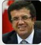
Nihat ZEYBEKÇİ T.C. Ekonomi Bakanı