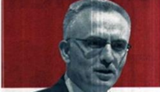
MALİYE BAKANİ NACİ AĞBAL

KOLAY VERGİ TOPLUYORUZ, OTODA ÖTV SİSTEMİ DEVAM EDECEK /15